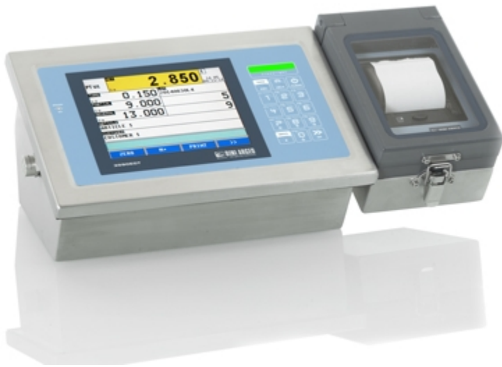
3590egt mit Edelstahl IP65 Drucker