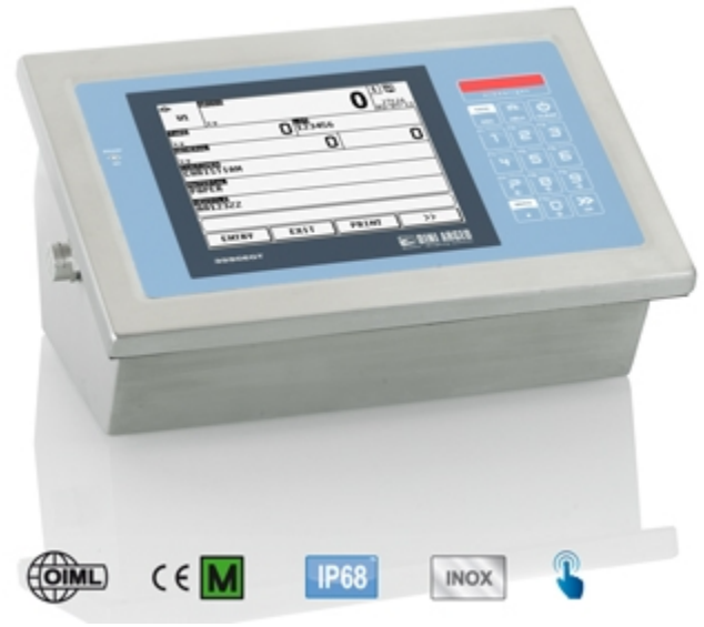
3590EGTXT01BC Edelstahl Gewichtsanzeige mit Touchscreen Display